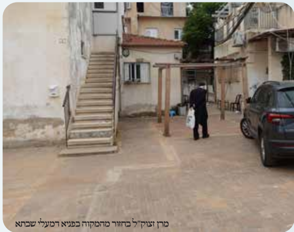
מרן זצוק"ל בחזור מהמקוה בפניא דמעלי שבתא