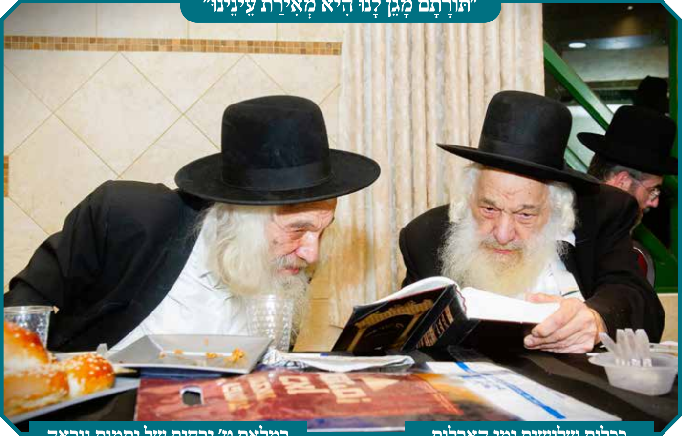
במלאת ט' ירחים של יתמות נוראה